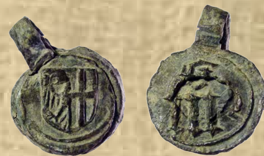
Plombák Memmingen és Dinkelsbühl posztójáról