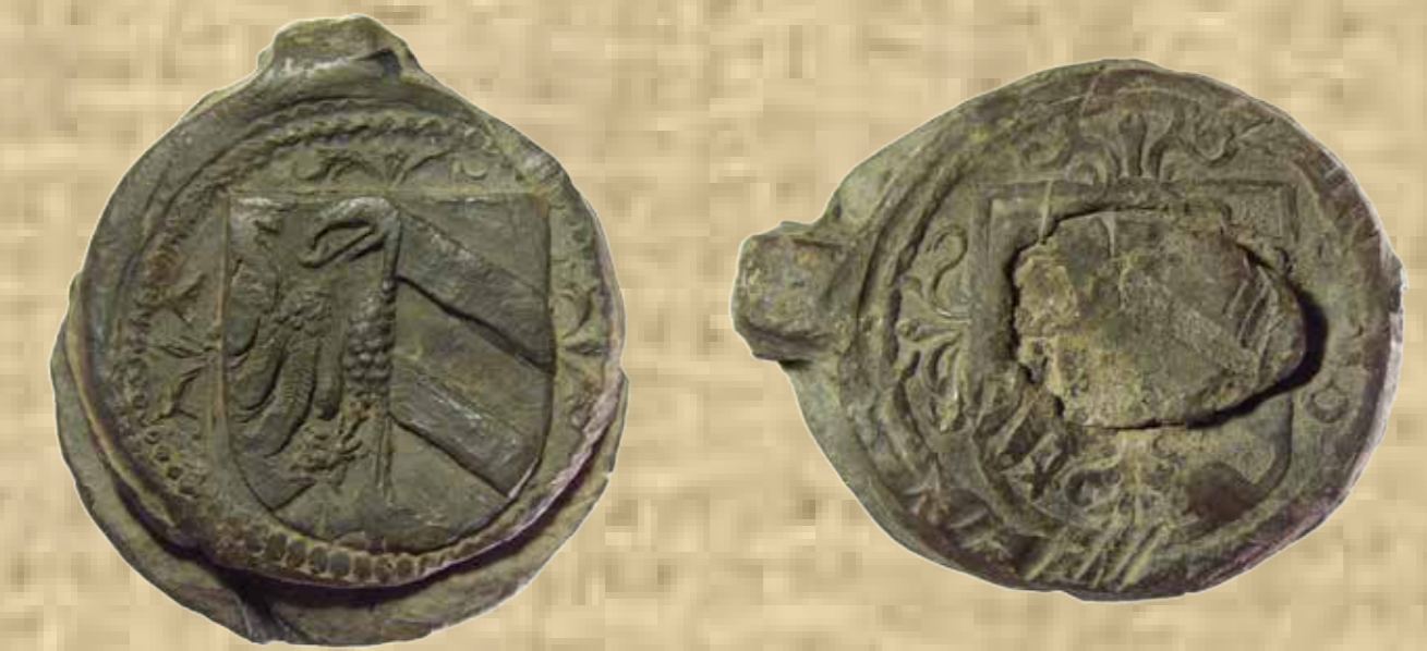
Nürnbergi plombák két fontosabb típusa és Szeged mai címere