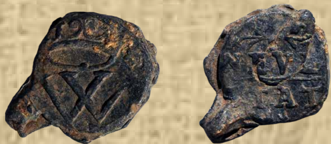
Neuhausiként azonosítható plomba