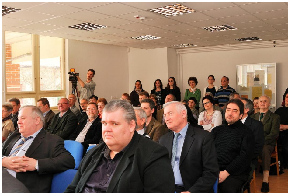
A 2016. évi Somogyi Levéltári Nap hallgatósága