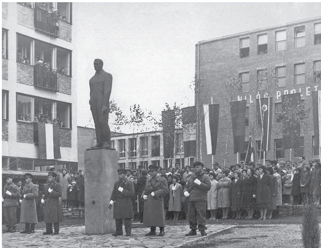
A Latinca-szobor avatása, 1962. november 7.