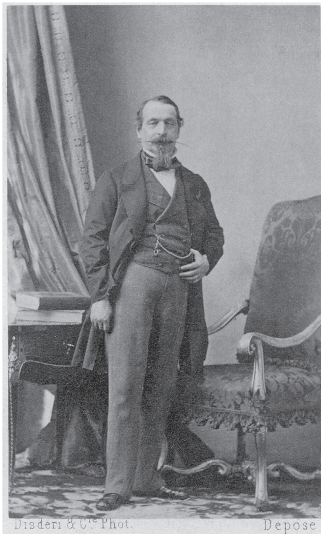
III. Napóleon francia császár°

Viszlát, terméketlen föld, Emberi veszedelmek, fagyos napsütés! Akár egy magányos fantom, Észrevétlen eltávozom, Viszlát, halhatatlan pálmák, Egy tűzből gyúrt lélek igaz ábrándjai! A levegő elfogy: becsuktam szármányaimat. Viszlát!