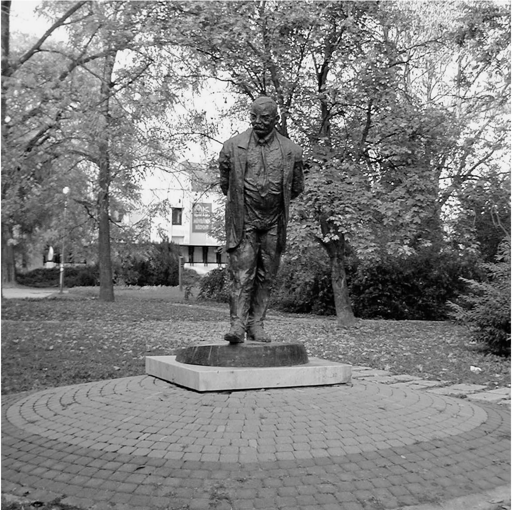
A kaposvári Nagy Imre-szobor