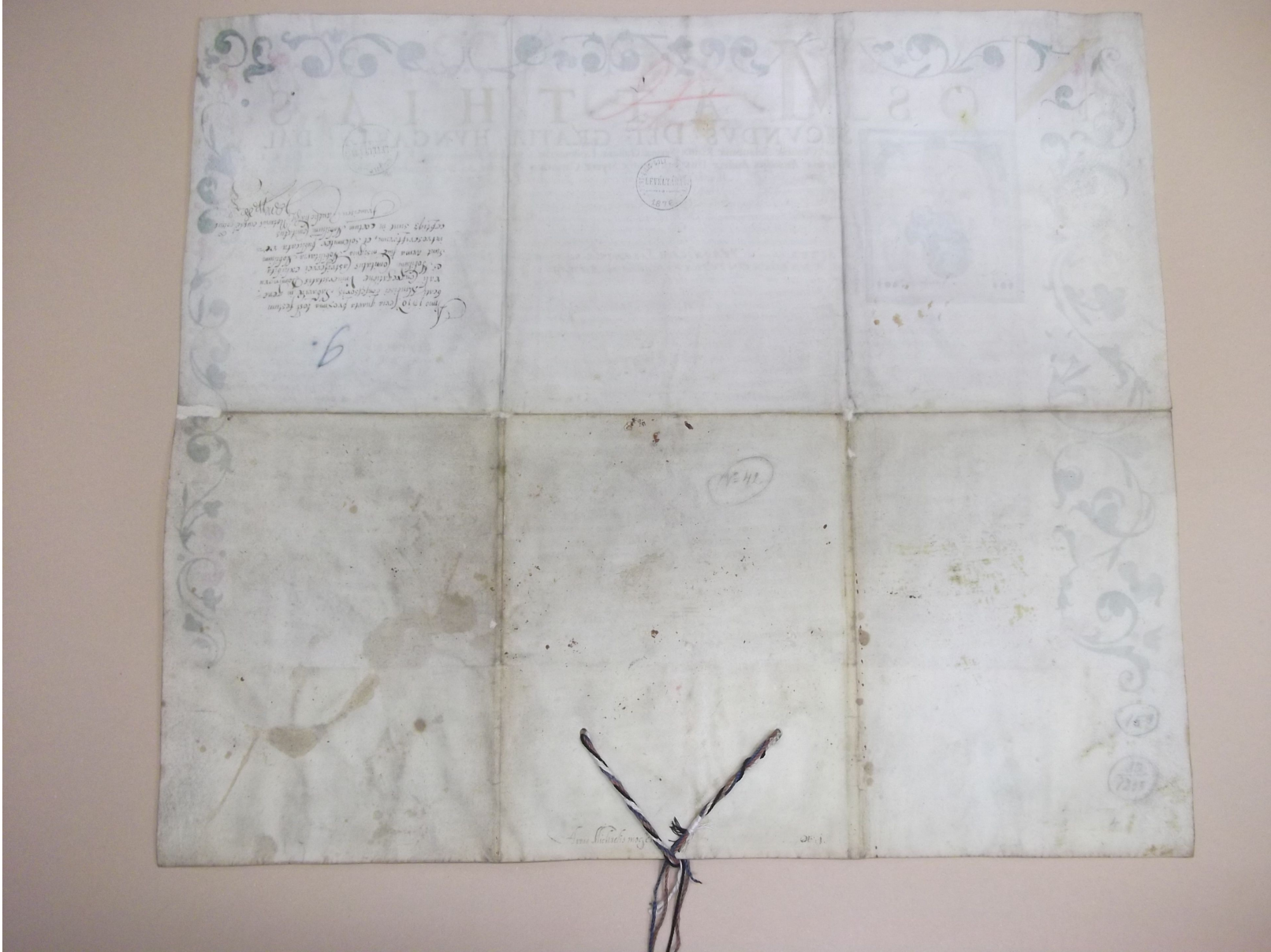
PML IV. 80-a. No. 7.