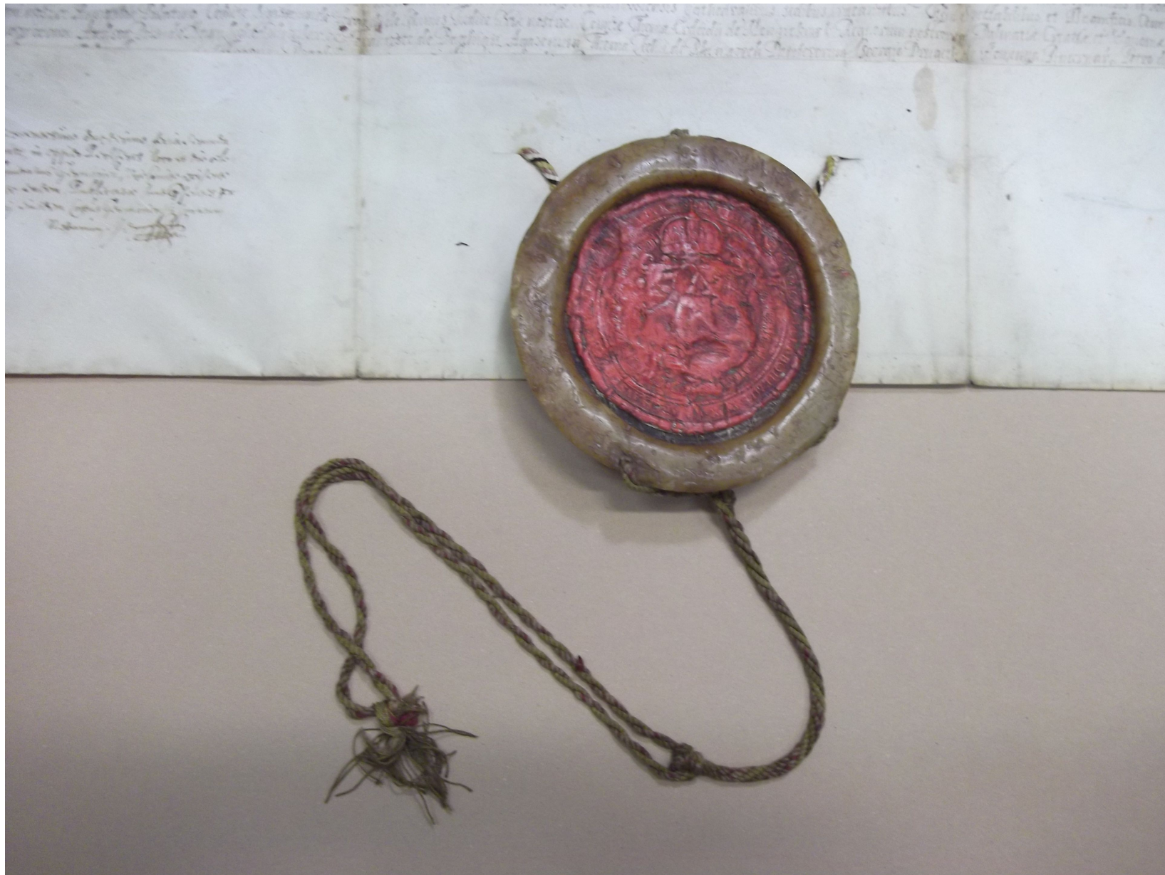
PML IV. 80-a. No. 8.