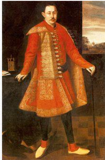
Nádasdi és fogarasföldi gróf Nádasdy III. Ferenc (Csejte, 1623. január 14. – Bécs, 1671. április 30.)