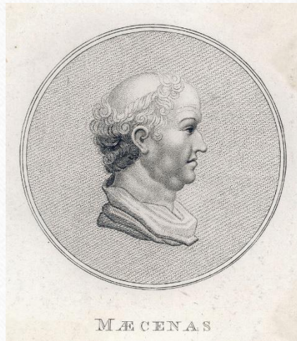
Caius C. Maecenas portréja, 18. századi metszet