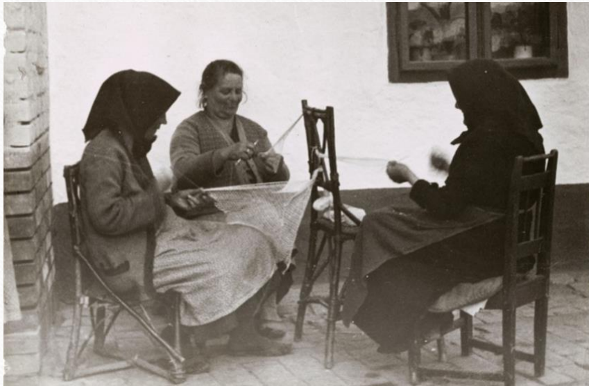
Kézimunkázó asszonyok 1930-as évek