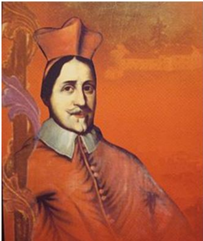
Draskovich György (1515-1587) győri püspök

1579-ban a Vas megyei Szombathelyen egyházmegyei zsinatot hirdetett, melyen a korban egyedülálló módon hirdették ki a tridenti határozatokat.