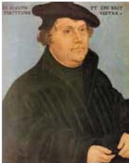
Id. Lucas Cranach: Luther Márton (1483-1546)