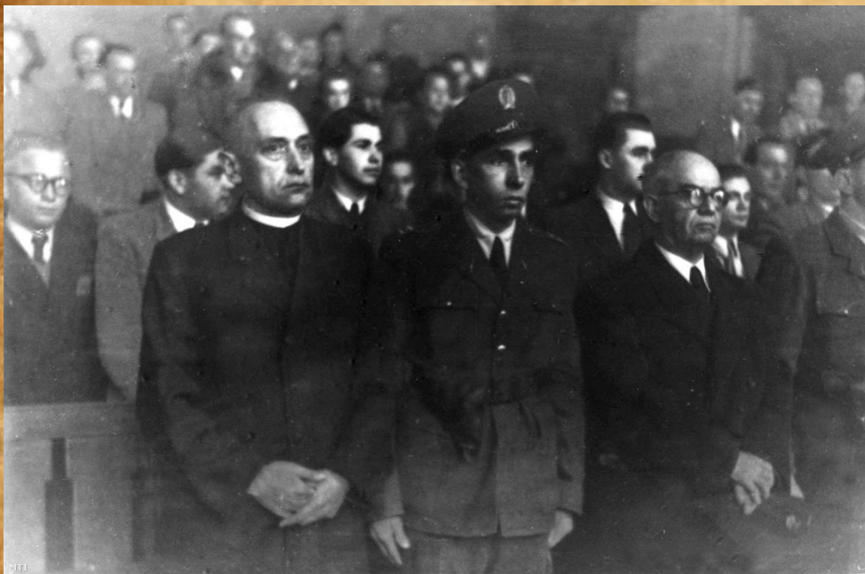
Mindszenty József hercegprímás (b) 1949 februárjában a bíróság előtt.

1948. december 26-án letartóztattak hűtlenség, a köztársaság megdöntésére irányuló bűncselekmény, kémkedés és valutaüzérkedés vádjával. Az államvédelmi hatóság hírhedt Andrassy út 60. alatti székházában heteken keresztül kínoztak, hogy beismerő vallomást csikarjanak ki belőlem.