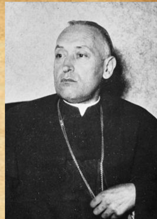
Mindszenty bíboros 1962-ben