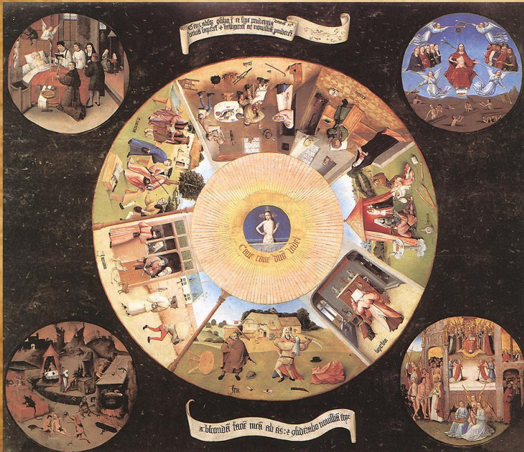
Hieronymus Bosch: A hét főbűn

A hagyományos lista szerint a hét főbűn : kevélység (büszkeség, gőg), fősvénység (kapzsiság, zsugoriság), bujaság , irigység , torkosság (mohóság), harag , és jóra való restség (lustaság)