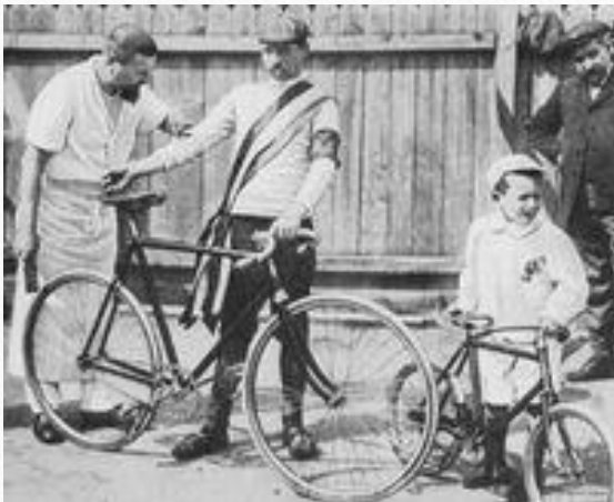
Az első Tour de France 1903-ban