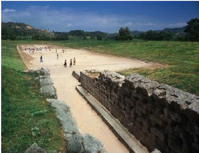
Az olümpiai stadion ma