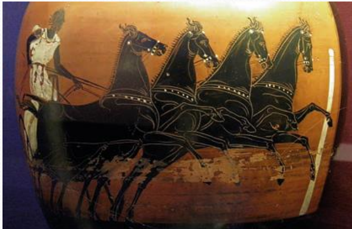
Négylovas fogat az athéni versenyen

Az első száz évben csak futószámok, öttusa, birkózás és ökölvívás szórakoztatta a nézőket. A leglátványosabb programot, a - négyes fogatok versenyét csak közel száz évvel később rendezték meg Olümpiában.