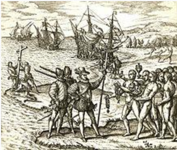
Kolumbusz Kristóf megérkezése Hispaniola ( La Isla Española ) szigetére 1492. december 5-én