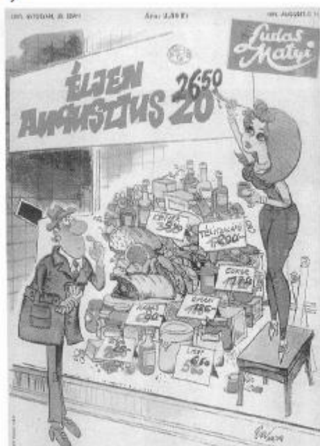
A Ludas Matyi nevű vicc lap címlapja 1979-ből.