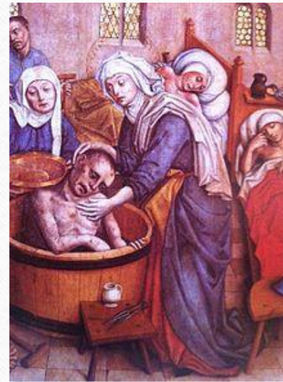
Erzsébet leprás beteget fürdet ábrázolás a kassai Szent Erzsébet-dóm 15. századi szárnyasoltárán