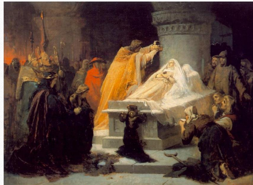
Leizen-Mayer Sándor: Erzsébet szentté avatása (1863 előtt, Magyar Nemzeti Galéria)

Így a halálos ágyamon szolgálólányomnak is csak annyit mondhattam: „Tudd meg, hogy nagyon boldog voltam...”