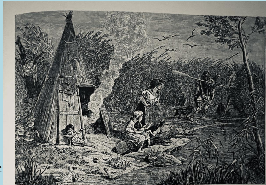
Élet az egykori nádrétegben

Időszakosan vagy állandóan vízzel borított terület: ~35353 ha = 55,2%