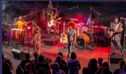
BENIN INTERNACIONAL MUSICAL