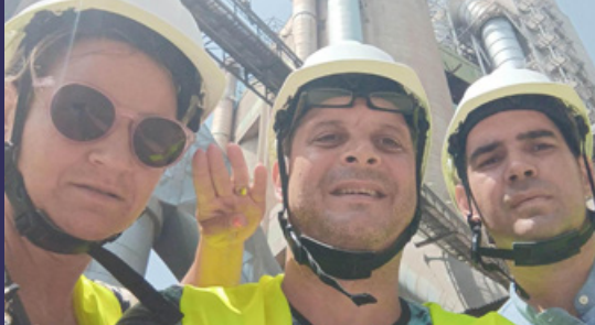
DCC - GYÁRLÁTOGATÁS

12.00-20.00 SEÁNSZ: a szerencsések bejuthatnak ebbe a varázslatos térbe, ahol a hetvenes évek Túrt-Tiltott alkotói