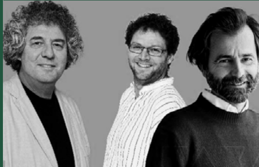
LÁNYOS ÉS FIÚS APÁK