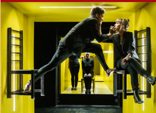
STUDIO K: NÉRÓ