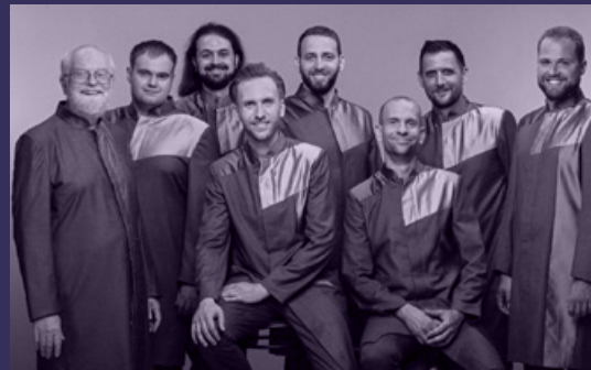
HÁY KÓDEX - SZENT EFRÉM