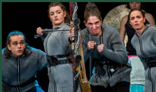
JOHANNA AVAGY MARADJUNK MÁR EMBEREK