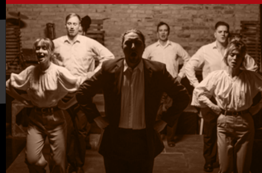
A NAGY ERDŐ, MELY TELE VAN HOMÁLYLYAL