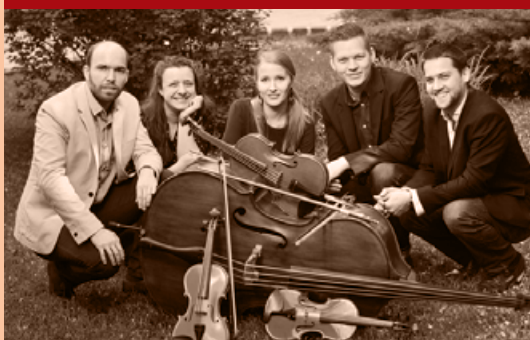
TÁNC HÁZ - SÁRARANY