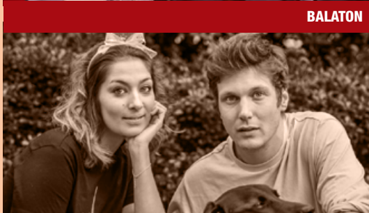
A HISZTIS KIRÁLYKISASSZONY