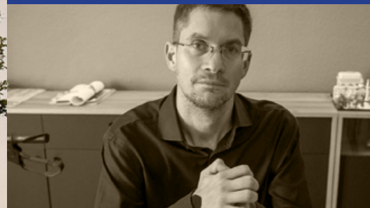
BESZÉLGETÉSEK AZ EUTANÁZIÁRÓL