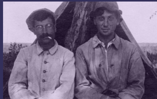
KIÁLLÍTÁS - ANDRÉ KERTÉSZ