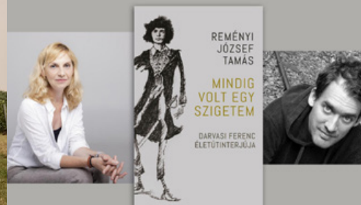
MINDIG VOLT EGY SZIGETEM