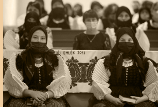
A HOSSZÚ ÚTON – SZÉK 1967-2022