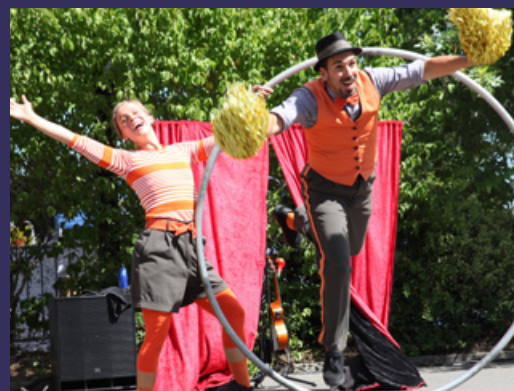
CIRQUE LES DUDES