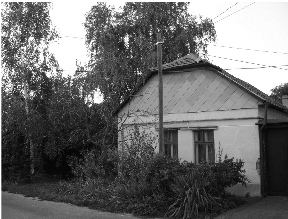
A kefekötő mester háza: Közép utca 12., 2005-ben, lebontása előtt

52 évesen asztalosipari szövetkezeti tag, rövid időn belül szakmunkás, majd mester lett, nyugdíjazásáig hasznosította a kefefákon megszerzett faipari tudását. A családban megmaradt keféi mellett kisbútorunk őrzi keze munkáját, melyeket nyugdíjasként is szívesen és nagy szakértelemmel készített, javított.