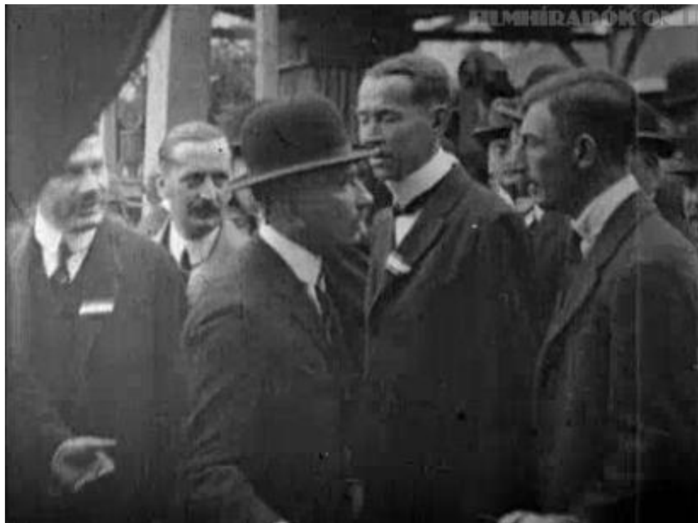
11. kép. Rakovszky Iván belügyminiszter meglátogatja a kiállítást 79