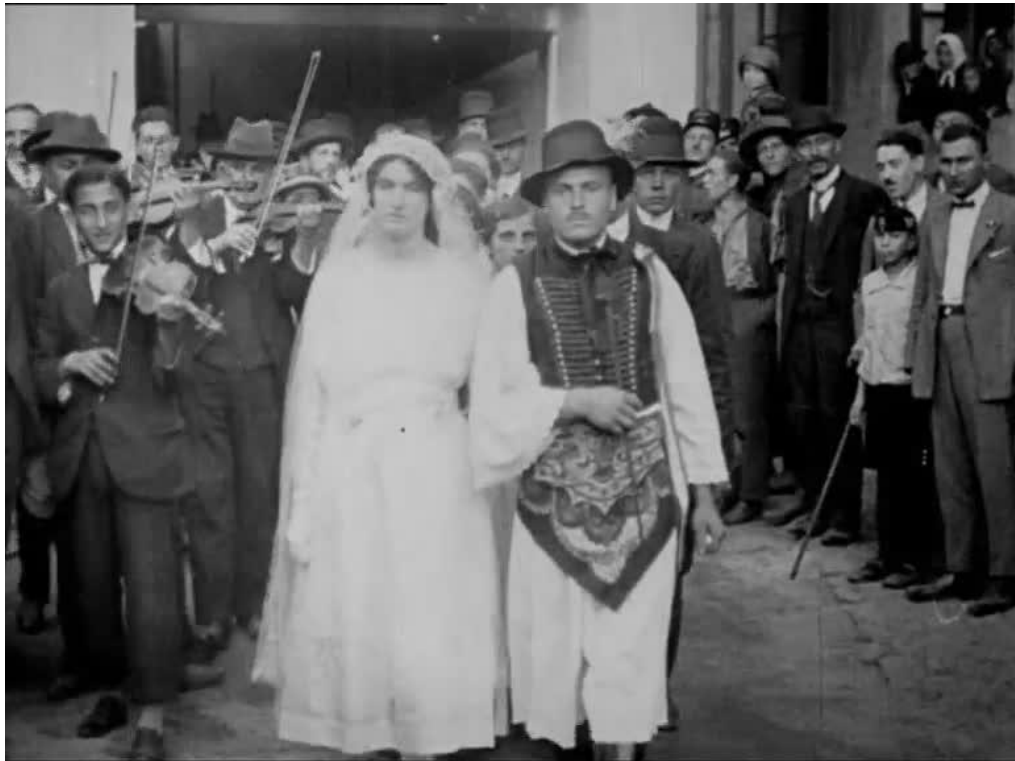
8. kép. Benkőbokori lakodalom és kecsketánc 76