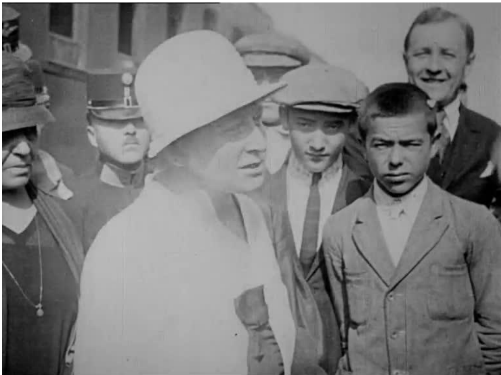
9. kép. A Mansz nyíregyházi csoportja fogadja Tormay Cecil írónőt a vasútállomáson 77