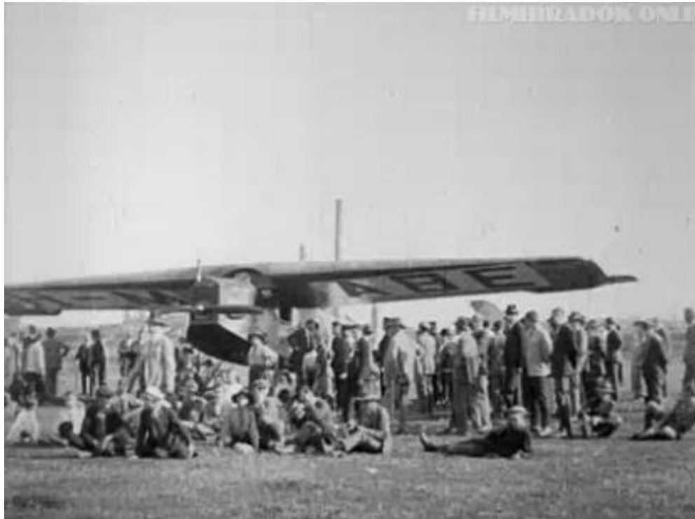
12. kép. A HADRÖÁ repülőbemutatója 80