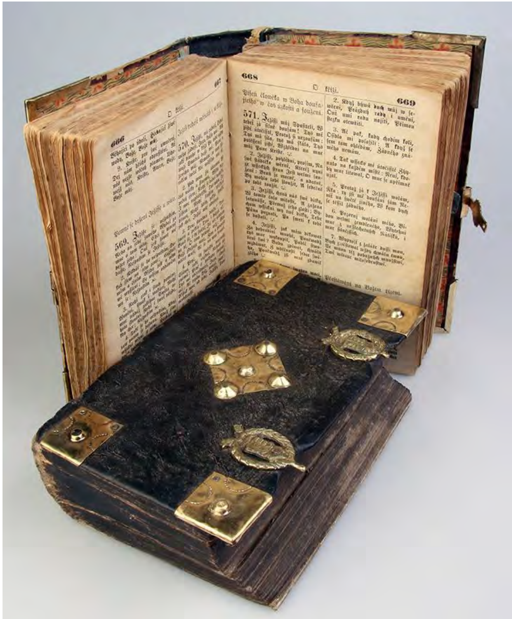
7. kép. Transcius 75