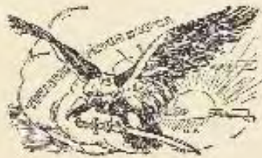
4. kép. Előszó: írta gróf Apponyi Albert 72