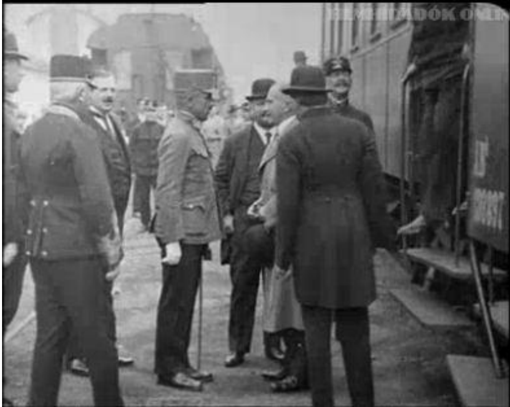
10. kép. Rakovszky Iván belügyminiszter fogadása a pályaudvaron 78