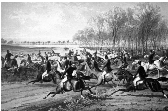
2. sz. kép Orczy Béla: Teli hang