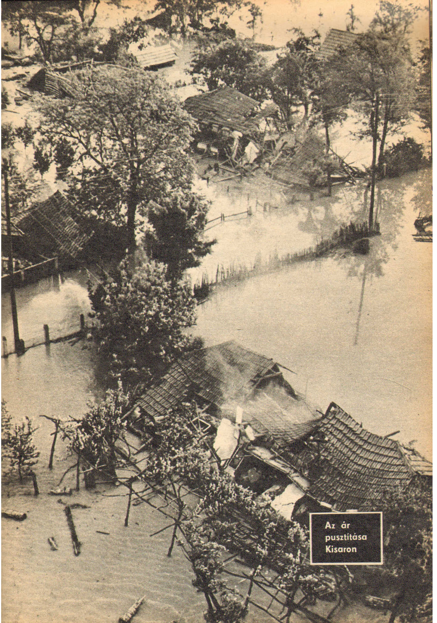
Az ár pusztítása Kisaron