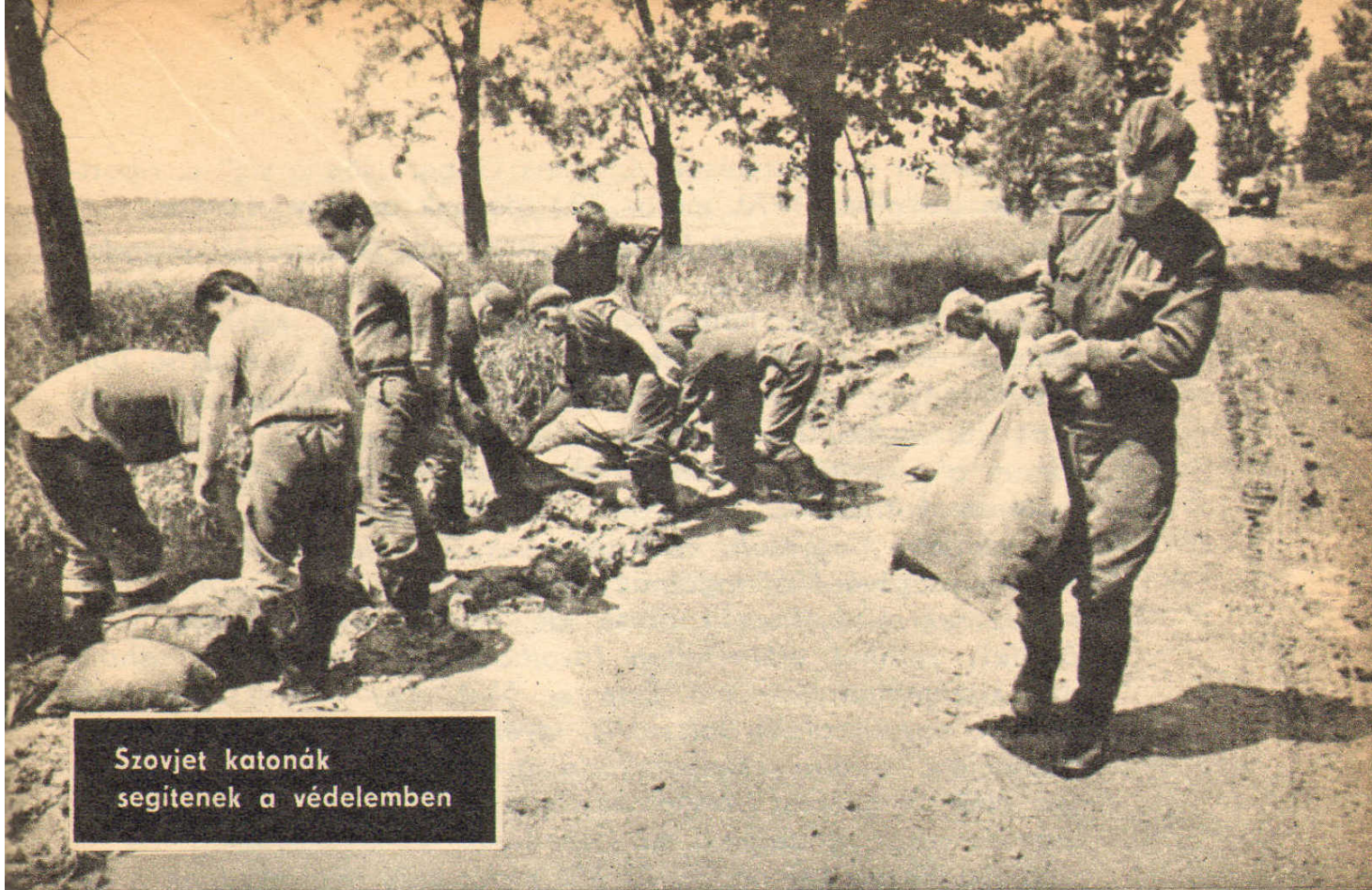
Szovjet katonák segítenek a védelemben

megkapnak ellátásuk biztosításához, s ahhoz, hogy minél hamarabb visszaköltözhesse nek elhagyott falvaikba. Csak az öregek közül nem akarták egyesek elhagyni otthonukat, hiszen a kis ház s a benne levő holmi egész életük munkájának eredményét, életük alkonyának biztonságát jelentette. Némelyeket szinte erőszakkal hoztak le a mentők a padlásról s emeltek csónakba, ahonnan kétségbeesve vetettek búcsúpillantást az özönlő víztömeg sodrában összeroppanó házukra.