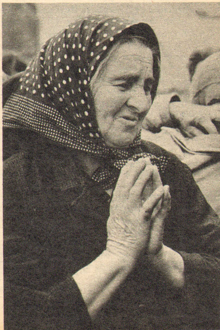
Egy panyolai néni otthonát siratja

megkapnak ellátásuk biztosításához, s ahhoz, hogy minél hamarabb visszaköltözhesse nek elhagyott falvaikba. Csak az öregek közül nem akarták egyesek elhagyni otthonukat, hiszen a kis ház s a benne levő holmi egész életük munkájának eredményét, életük alkonyának biztonságát jelentette. Némelyeket szinte erőszakkal hoztak le a mentők a padlásról s emeltek csónakba, ahonnan kétségbeesve vetettek búcsúpillantást az özönlő víztömeg sodrában összeroppanó házukra.