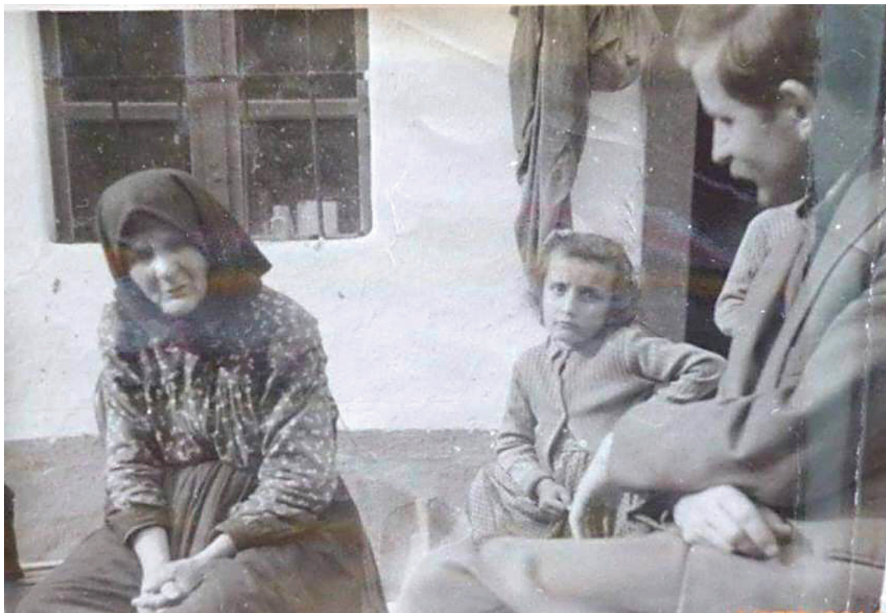
Ükmamám és nagymamám, 1961

esti morzsolás vagy fonás közben, és az unokáinak – közöttük a nagymamámnak is – rengeteget mesélt. Nagyból 1947-ben kezdte a mesélést. 1953-ban megismert egy budapesti hölgyet, Dégh Lindát, aki néprajz és népmesekutató volt. Egy angol nyelvű könyvében, ahol a Völgység mesemondóit mutatta be, ükmamáról is írt, valamint két könyvet írt ükmamám meséiből. Az ükmamám meséi országos szinten híresek lettek. 1954-ben Budapestre hívták, hogy meséljen ott is a meséi közül. 1954. augusztus 14-én Budapesten kitüntették a Népművészet Mestere díjjal. Leghíresebb meséi: Nemtudomka, Peti és Boris, Égig érő fa, Bolhakisasszony, Sándor királyfi és Lajos királyfi, Gagyi gazda. A meséi nagyrésze átvett, amit saját verziójává formált, de vannak olyan meséi is, amiket ő maga talált ki.