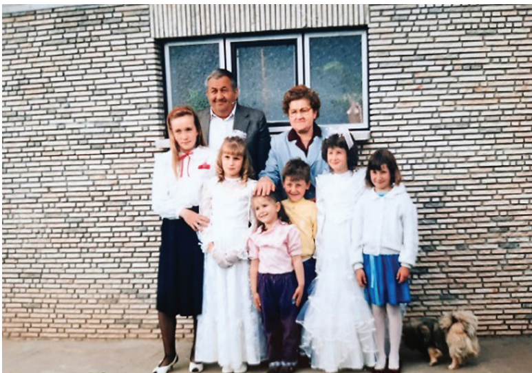
Dédszüleink együtt a 6 unokával