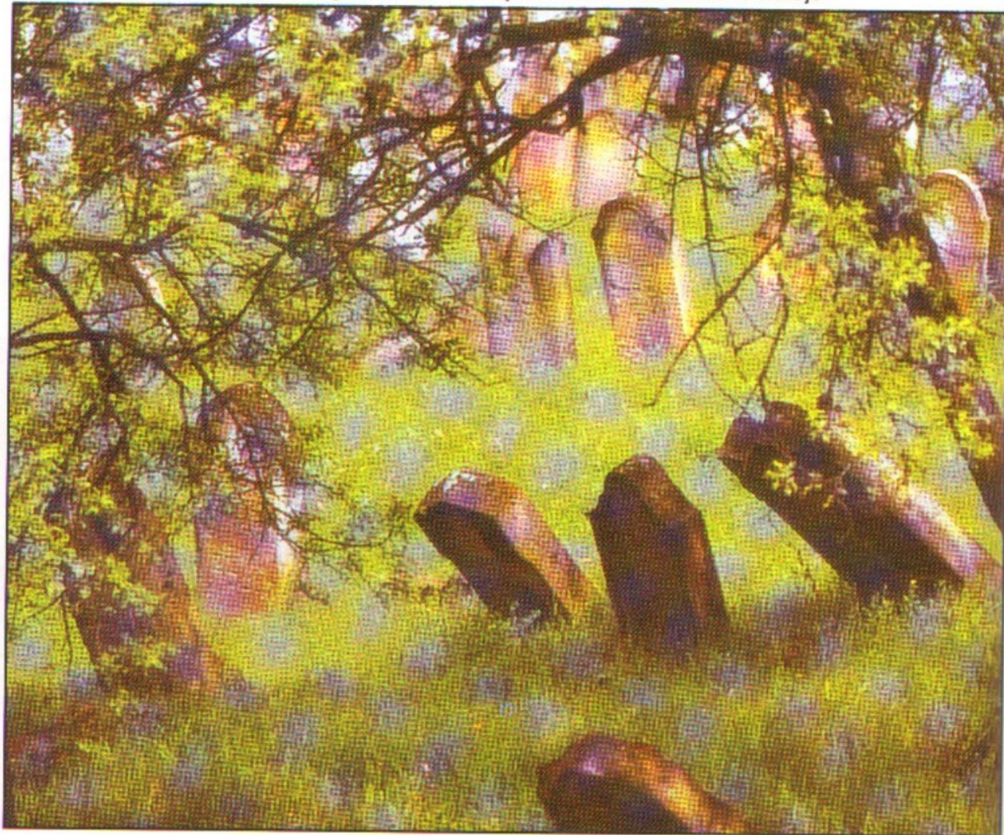
Az egykor legendás zsidóközpontnak számító Mád temetője

A gettóbeli szenvedések, megpróbáltatások a bevagonírozási központokban, a gyűjtőtáborokban folytatódtak. Azon túl, hogy itt az életkörülmények lényegesen rosszabbak voltak, mint a gettóban, a fogva tartottak számára az is súlyos terhet jelentett, hogy el kellett hagyni a várost, az ismerős utcákat, tereket. El kellett hagyni az embereket, akiknek egy része közönyösen szemlélte sorsukat, egy része hangos szóval