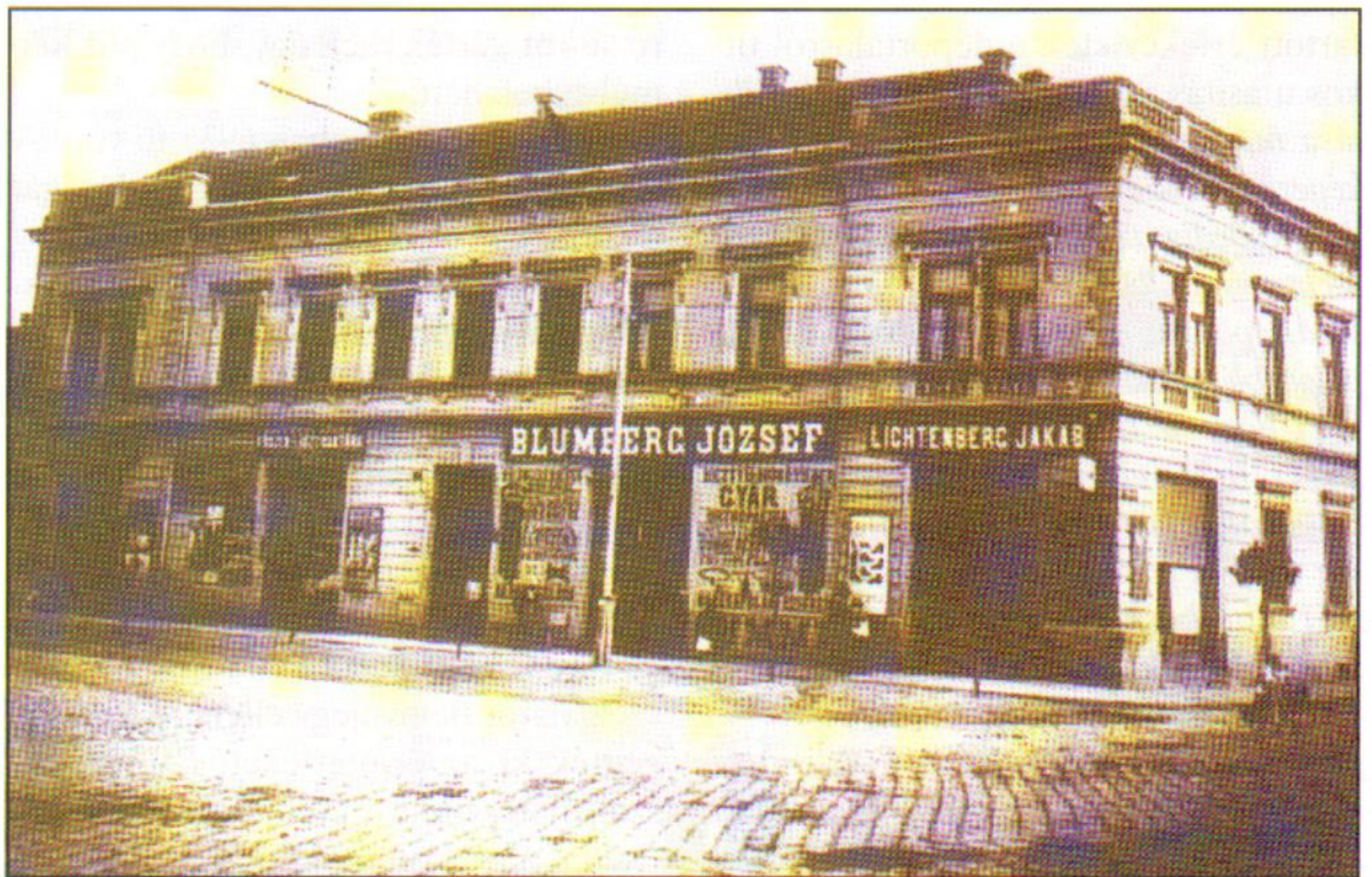
Zsidó cipőüzlet és katolikus plébánia egy épületben. Nyíregyháza, 1910 körül

Április 16-án, hajnali 5 órakor az akció elindult. Elsőként a város környéki települések zsidóságát verte fel a csendőrök puskatusa. Tizenöt percet kaptak, hogy élelmet és ruhaneműt vegyenek magukhoz. Ez idő alatt is folyamatosan zaklatták őket az ékszerek, aranytárgyak beszállítása miatt. Ha a településen volt zsidó közösségi épület, oda kísérték őket, ha nem, akkor a legközelebbi ilyen településre. Gyalog, zárt sorokban, csendőr-