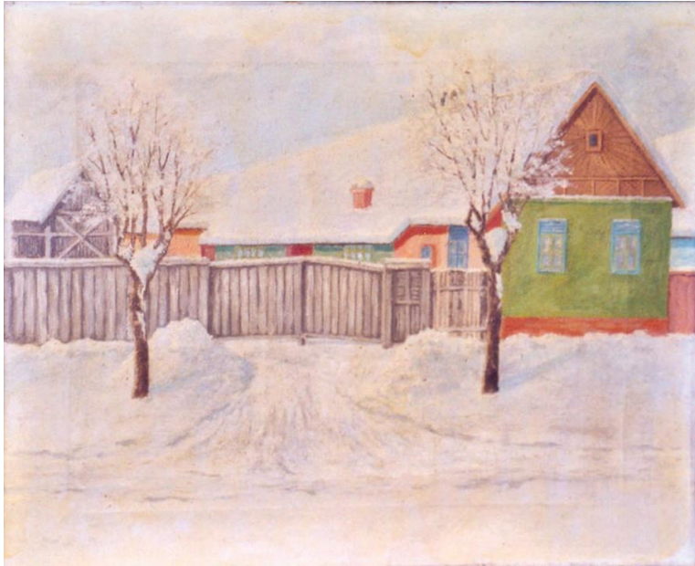
Napsugaras zöld ház