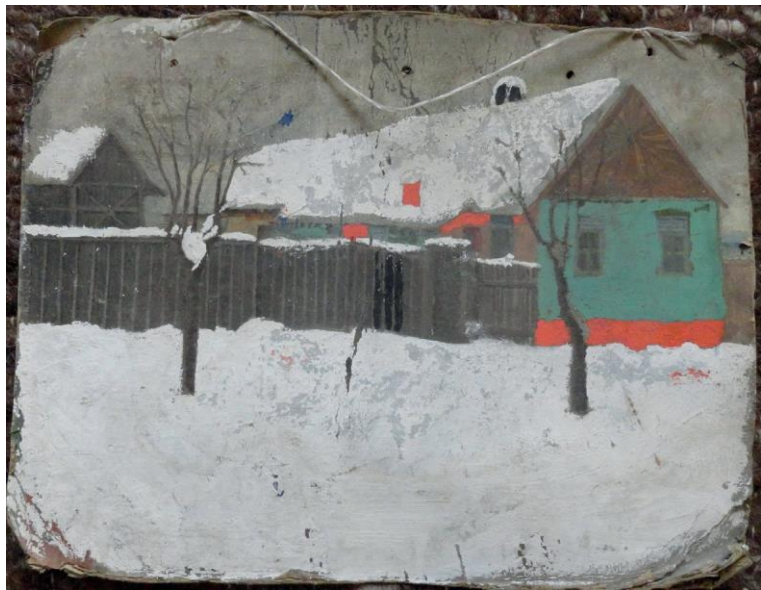
Zöld ház – vázlat