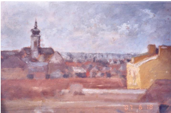
Szeged. kilátás a Szentháromság utcai műteremből