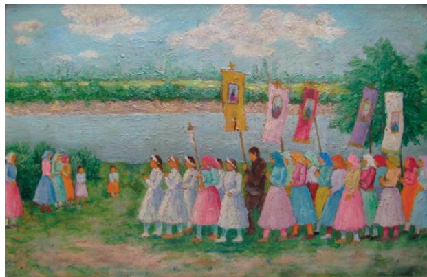
Tápai emlék a 60-as évekből