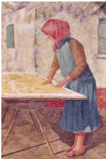
Annus néni vagy A tarhonyás asszony

Tápé és Szeged az 1920 – 1930-as években