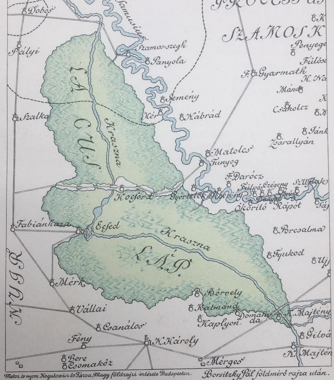
M r Ecsedi L p 1780-ban.

A k p forr sa:  ble G bor: Az ecsedi uradalom  s Nyiregyh za, gazdas gt rt neti tanulm ny: lev lt ri hiteles okiratok nyom n. Budapest, 1898.