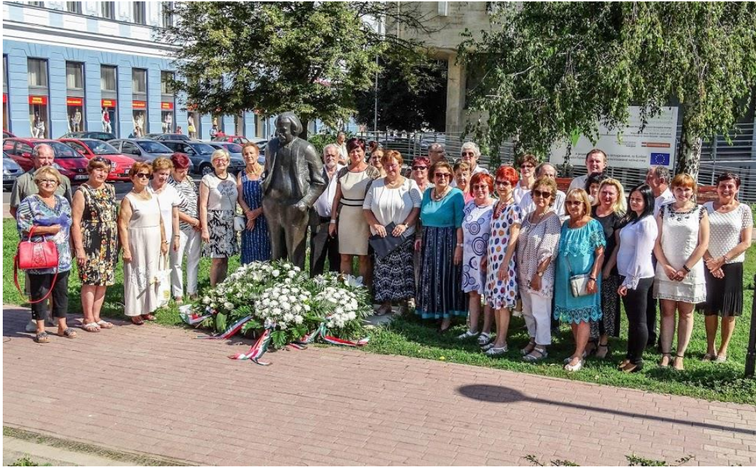
26. sz. melléklet: A Mór-Évforduló Kulturális Egyesület tagjai a Mór-émlékezést követően névadónk szobránál Nyíregyházán (2019)