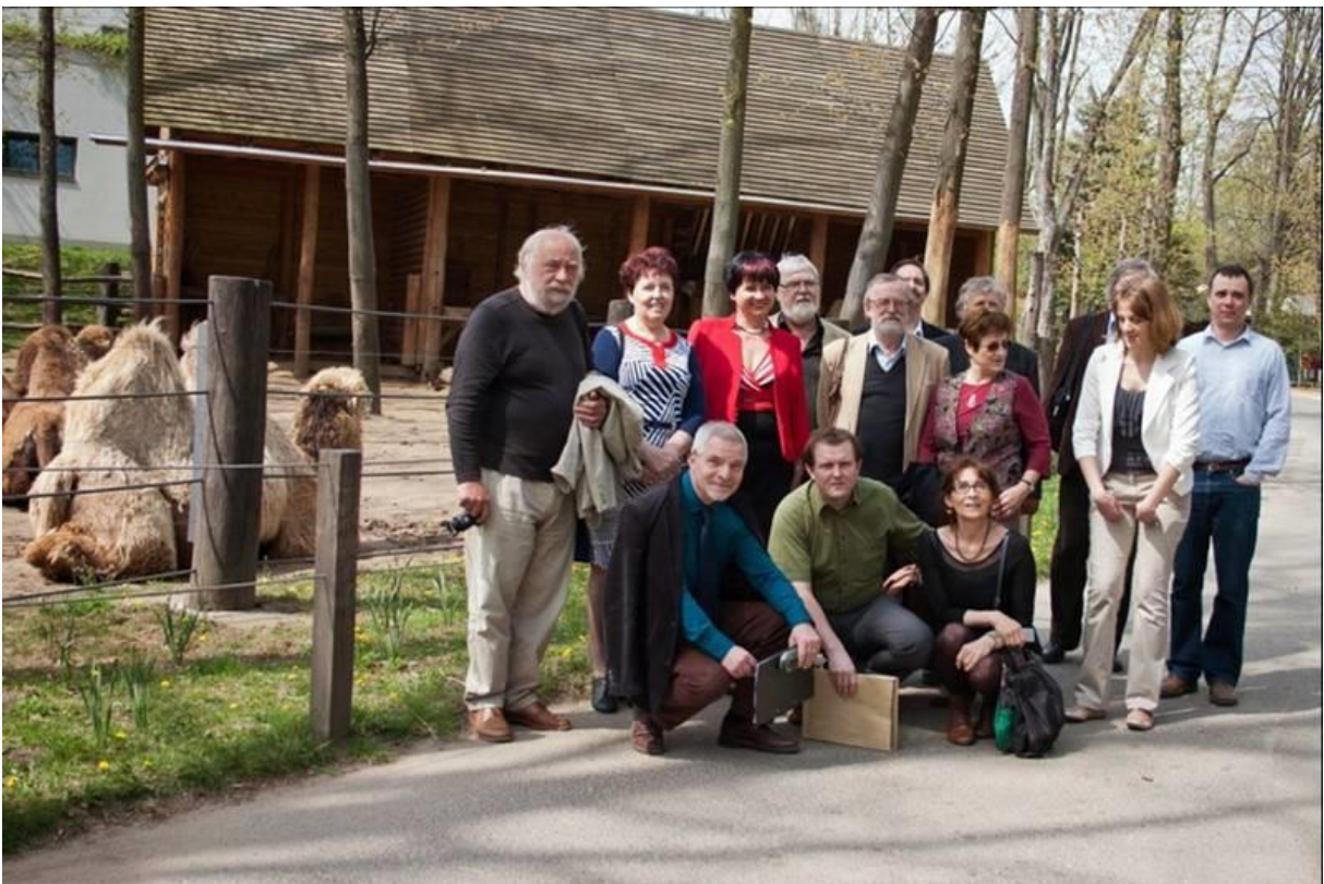
10.sz. melléklet: A Nagy az Isten állatkertje c. tudományos konferencia előadói és szervezői a sóstói Állatparkban (2015)