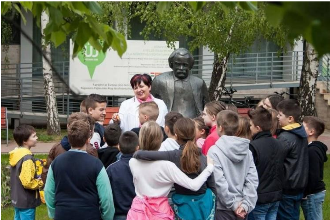
18.sz. melléklet: Az irodalmi séta első állomásán a Kő Pál alkotta Móricz Zsigmond szobornál