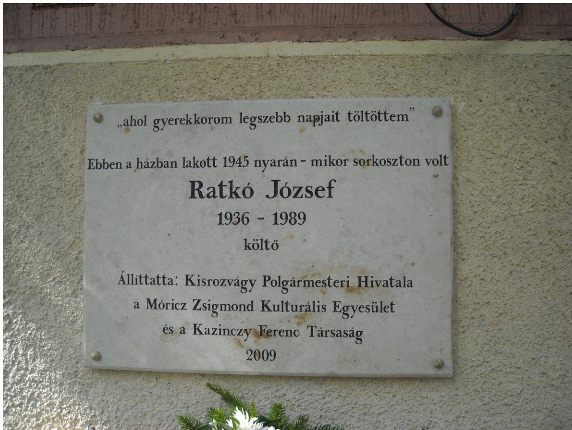
5. sz. melléklet:Ratkó József emléktáblája Kisrosvágyon