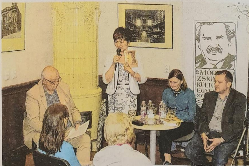
Nagy sikere volt a kötetnek Budapesten is