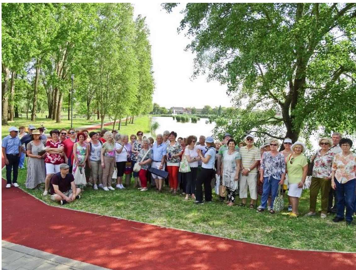
22.sz. melléklet: A vadregényes Bujtosi zenés irodalmi délután (2021)