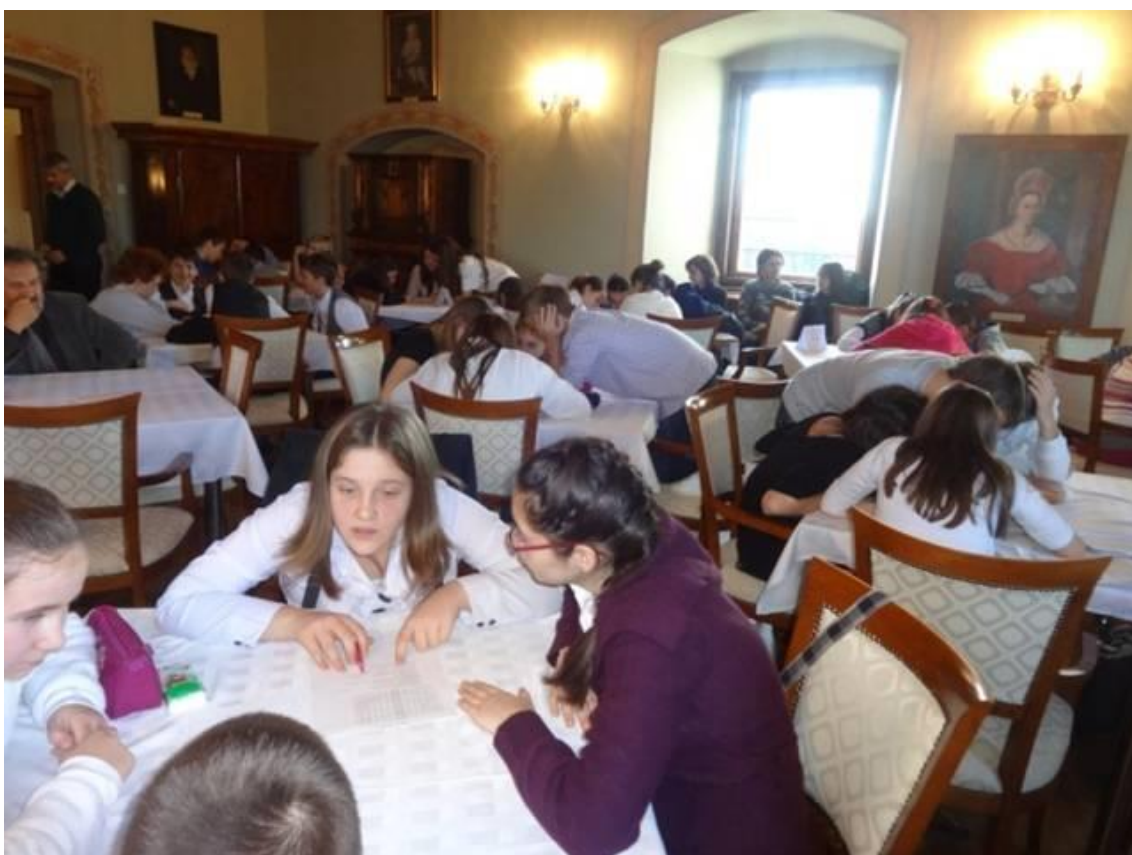
20.sz. melléklet: Megyei Rákóczi verseny általános- és középiskolásoknak Vaján (2013)