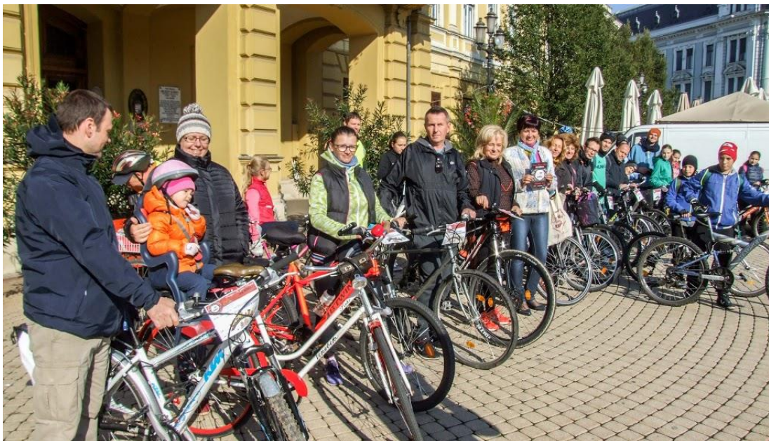
24. sz. melléklet: Startol a Bringával a könyvtárba c. program a Kossuth téren, a Közösségek Hetén - a Zöld Kerék Alapítvánnyal (2016)