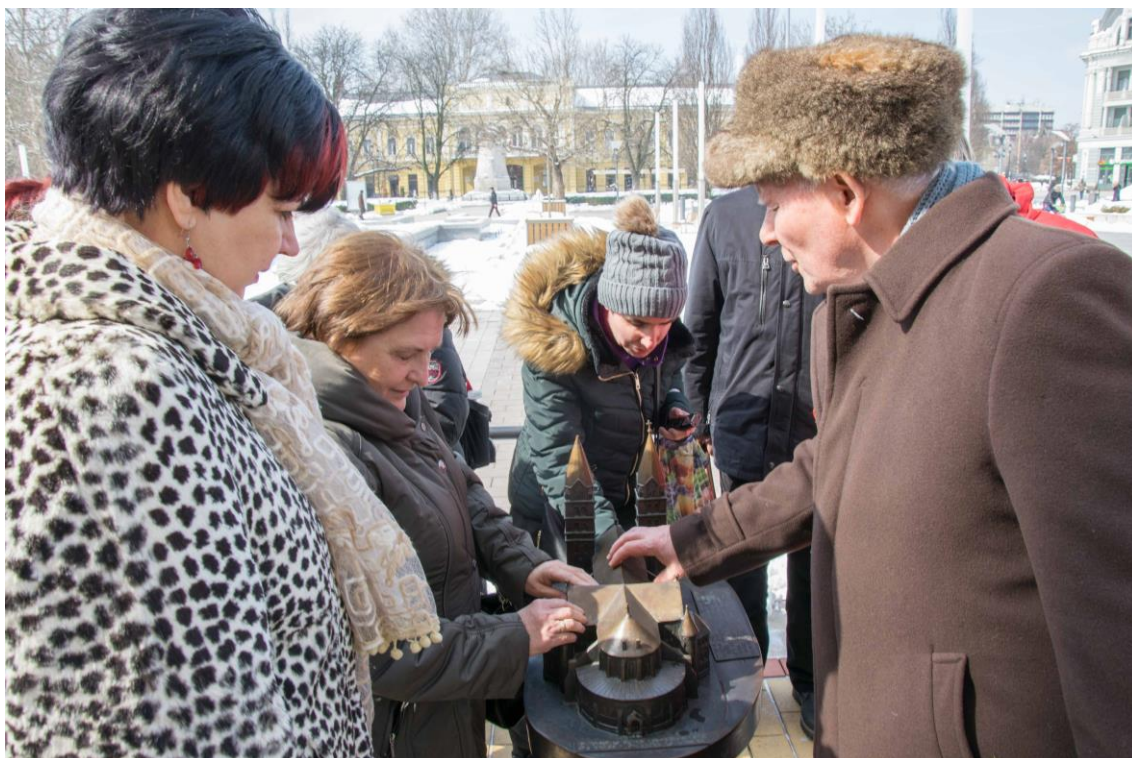
19.sz. melléklet: Városismereti séta a Vakok-és Gyengénlátók Országos Egyesülete tagjainak