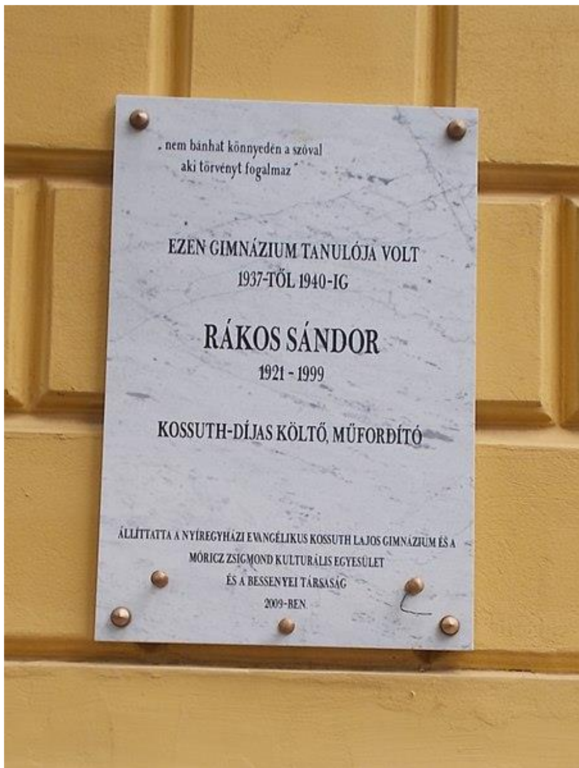
4. sz. melléklet: RákosSándoremléktáblája(Nyíregyháza, Szent István utca 17-19.)