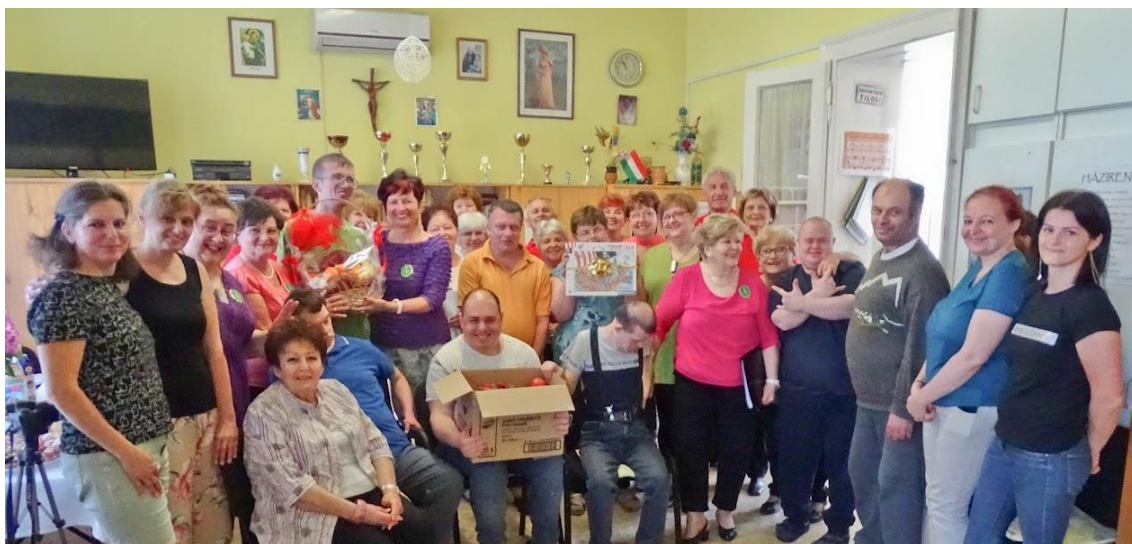
21.sz. melléklet: Az Egyesület gyermeknapi műsora a Szent József Védőotthon fiataljainak (2022)