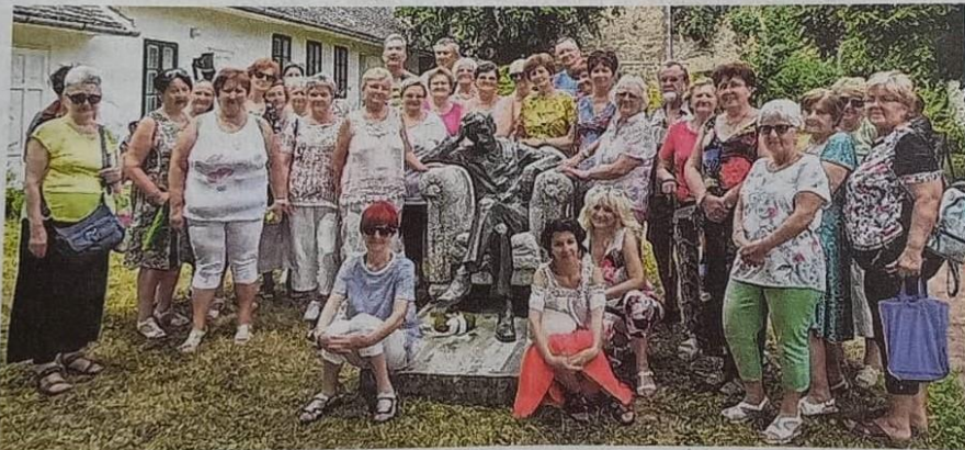
Babits Mihály szobránál az egyesület tagjai