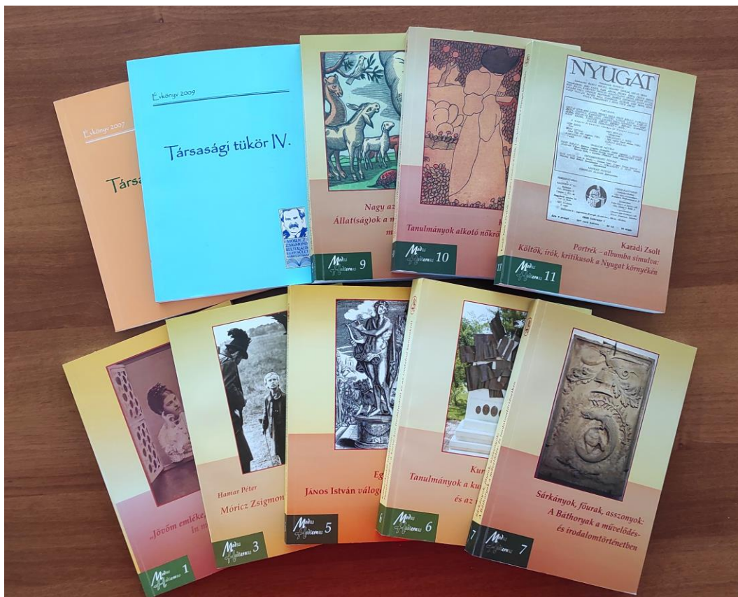
12.sz. melléklet: Válogatás az Egyesület kiadványaiból