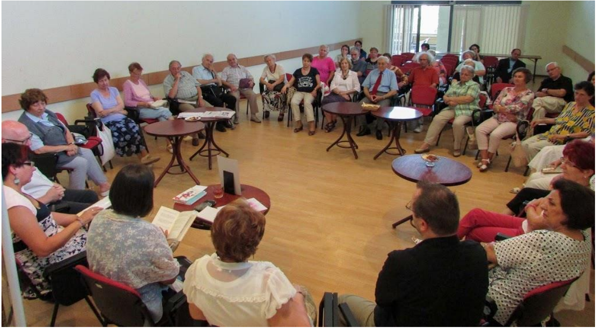
17.sz. melléklet: A Móricz Zsigmond Olvasókör találkozója. Téma: Ratkó József költészete (2019)