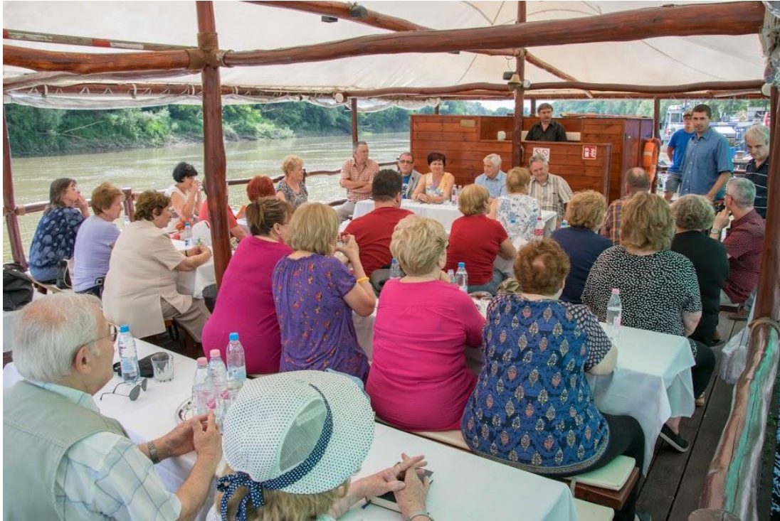
23. sz. melléklet: Zenés irodalmi délután a Tiszán (Jánd,2017-Tiszavirág tanyahajó)