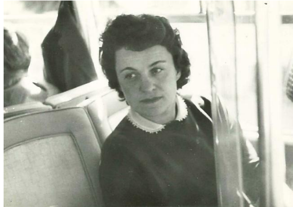
Dédmamám az 1960-as években