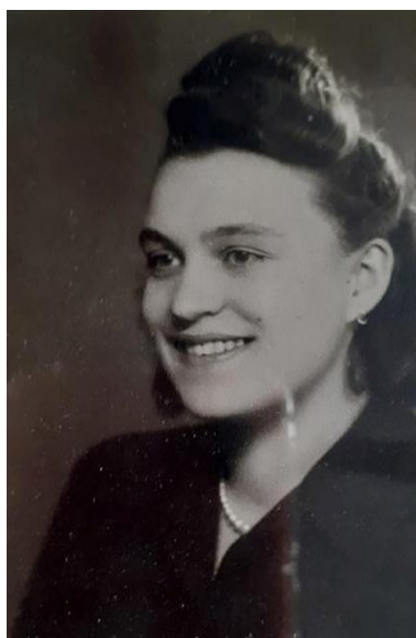
Dédmamám az 1950-es évek elején