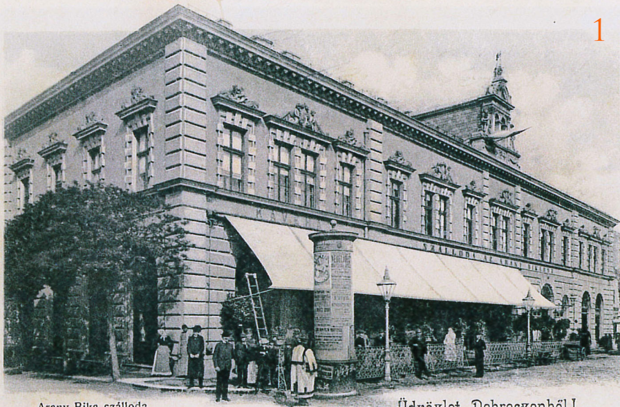
Arany Bika szálloda.