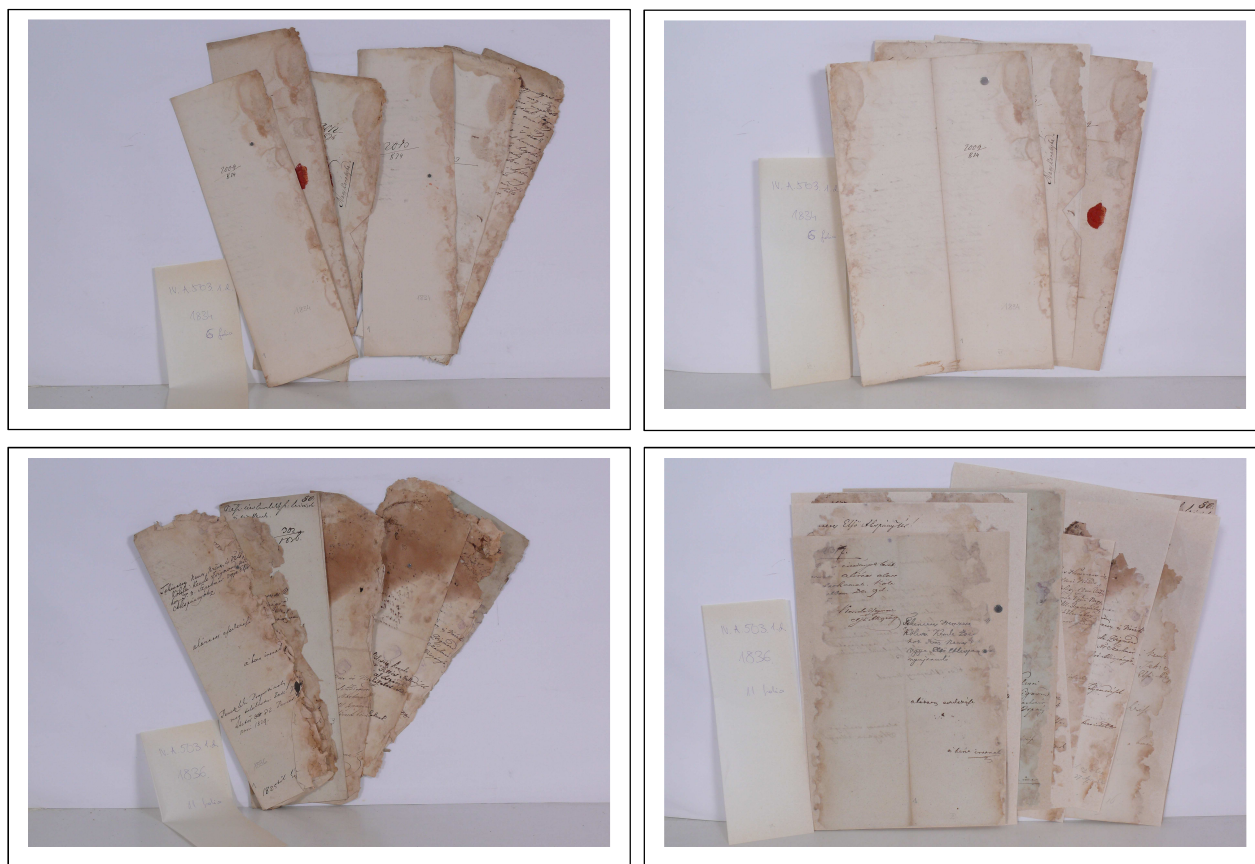
Szatmár vármegye első alispánjának iratai restaurálás előtt és után

ArchivArt Könyvrestaurátor Műhely Kft. 1088 Budapest, Üllői út 2-4. I. emelet 1. Tel./fax: 36-1/306-4574