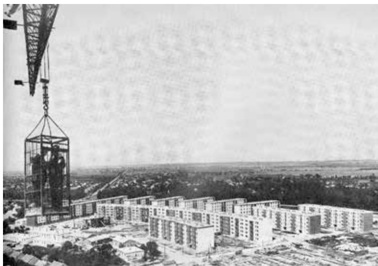
Szeged-Tarjánváros épülő I. ütemének téglablokkos tömbjei a félkész víztoronyból 1969 körül.

kótelepépítési láz" csúcspontja az 1960-as évek volt: azonban míg Nyugat-Európában már a '70-es években felismerték, hogy milyen új társadalmi problémákat okoznak a sok esetben „elgettósódó” városrészek, addig a vasfüggönyön túl egészen a rendszerváltozásig zajlottak az építkezések. Szeged-Tarjánváros építési időszakaiban, az 1960-as évektől az 1980-as évek végéig, Magyarországon az új lakásoknak több mint felét a lakótelepeken adták át – hasonlóan a Német Demokratikus Köztársasághoz (NDK) és Romániához, de elmaradva Csehszlovákiától, vagy a Szovjetuniótól, ahol ugyanez az érték meghaladta a 60 százalékot. Az 1990-es évek elejére a KGST európai tagállamai között a középmezőnyben helyezkedett el Magyarország, a lakások 29 százaléka számított lakótelepnek. 2 A 2000-es évek elejére a dél-alföldi régió megyeszékhelyein a panellakások aránya az összes lakáshoz képest elérte ezt az értéket, Szegeden pedig meghaladta a 36 százalékot. 3 A város lakótelepein 1964 és 1990 között 734 paneles szerkezetű és 74 téglablokkos épületet adták át. Az összesen 28 001 lakásban mintegy 72 ezer fő lakott 1990-ben, 4 a 2001-es adatok szerint pedig az aktív korúak 38,5, a teljes lakosság 38,9 százaléka élt lakótelepen. 5