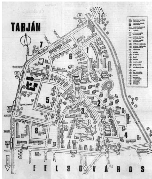
Szeged-Tarjánváros térképe a '70-es évek közepén. (Délmagyarország 1974. július 14. 8.)