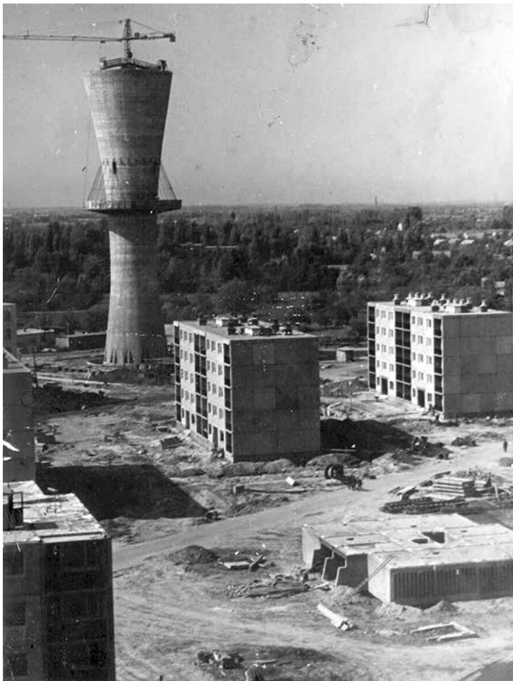
Szeged-Tarjánváros II. üteme és az épülő víztorony az elsőként felépített tízeleletes panelházból 1969-ben.