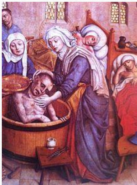
Erzsébet leprás beteget fürdet ábrázolás a kassai Szent Erzsébet-dóm 15. századi szárnyasoltárán

A szent életű asszony legbensőbb titka és egyik legvonzóbb tulajdonsága, hogy tökéletes összhangot tudott teremteni az Isten és a férje iránti szeretet között.