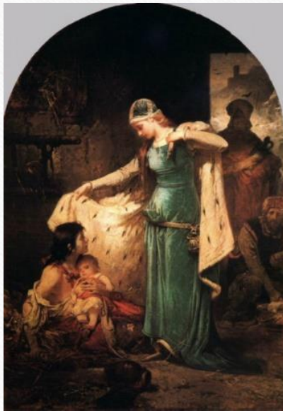
Leizen-Mayer Sándor: Árpád-házi Szent Erzsébet (1882 előtt, Magyar Nemzeti Galéria)