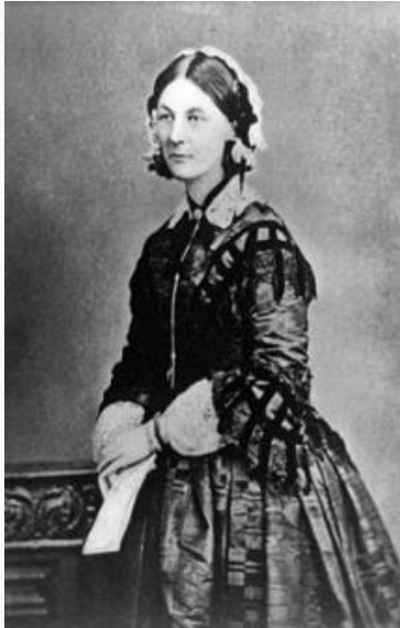
Florence Nightingale 1860 körül

Első állását 1853-ban egy londoni női kórházban töltötte be. Minden addigi tapasztalatát felhasználva irányította az előkelő hölgyeket ellátó intézményt, forradalminak számító újításokat vezetett be: pl. ételhordó lift a házban, emeletekre beosztott ápolónők, hogy ne a lépcsőzéssel menjen el az idejük, olyan csengő, amely mutatja a szobaszámot. A bizottsággal már az első héten összetűzésbe került, mert ki akarták tiltani a kórházból azokat, akik nem az anglikán egyházhoz tartoztak. Florence azonban ragaszkodott hozzá, hogy az ellátás mindenkire vonatkozzon, vallási hovatartozástól függetlenül. Egész életében ezt az elvet vallotta, és azt remélte, hogy eljön majd az az idő, amikor nem az emberek vallását nézik, hanem a lelküket. Később többen kiemelték, hogy harcol a női jogokért, de ő tiltakozott, mondván, hogy harcol a szenvedőkért, függetlenül attól, hogy férfi vagy nő az illető. Az 1854-es londoni kolerajárvány idején önkéntes ápolónőként dolgozott, betegei rajongtak érte, földre szállt angyalként emlegették.