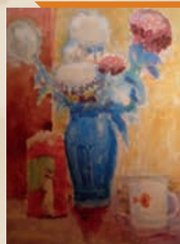
Áldozó József: Virágcsendélet, 1930-40-es évek