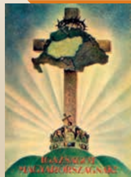
Igazságot Magyarországnak! plakát, 1930-as évek