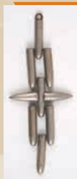
Háborús emléktárgy, 1916 körül

Angliában például a kormány több tonna hadianyagot – főleg fémeket – értékesített, hogy abból a háborúra emlékeztető ajándéktárgyakat készítsenek. A háborús emléktárgyak egyes típusaiból sokszor az iparművészet szintjére emelt használati- és dísz tárgyak bizonyos szempontból megtermékenyítően hatottak, sőt némely esetben meg is határozták az 1920-as, 30-as évek ízlésvilágát.