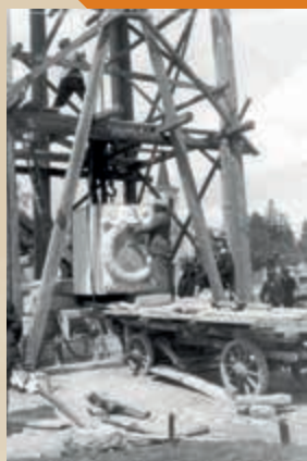
A magyaróvári I. világháborús emlékmű építése, 1938

Az I. világháborús emlékművek feldolgozása Magyarországon az 1980-as évek óta tart. Az azóta megjelent tanulmányok tisztázták az emlékműállítás történeti hátterét, főbb típusait. Számos részlettanulmány született az egyes településeken, megyékben felállított emlékek történetéről, digitális adatbázisok készültek. Magyarországon a világháborús emlékművek megítélése mégis problematikus. Gyakori a negatív felhang, amely a monumentumok kétes művészi értékére, a hamis pátoszra és az aktuálpolitikai (irredentizmus) felhasználásukra hivatkozik. Az emlékművek jobb megértése komplex kutatási programot kíván, melyhez az ikonográfiai, ikonológiai, tipológiai vizsgálat éppúgy hozzá tartozik, akár csak az emlékművek deformálásának, szimbólumaik manipulálásának, esetleg lerombolásának politikai-társadalmi kontextusa.