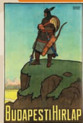
Bér Dezső: Budapesti Hírlap, plakát, 1918 körül