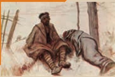
Mednyánszky László: Szerbiában, 1914