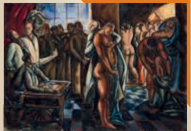
Uitz Béla: Sorozás, 1916

Az előadás az első világháború alatt született grafikai sorozatokat elemzi, rávilágítva a művek keletkezésének körülményeire, funkciójára. A modern háború széttagolt látványa és a grafikai sorozatok gyakorisága közötti összefüggést konkrét példákon mutatja be, felvillantva a műfaji előzményeket is.