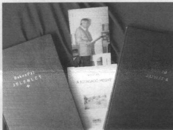
Bakos Pál legújabb köteteivel