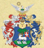
Debrecen Megyei Jogú Város