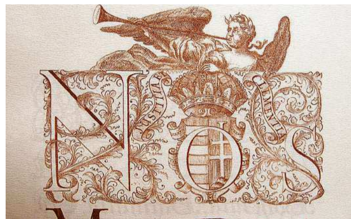
1740: Mária Terézia első királyi rendeletének fejléce a magyar kiscímerrrel

Az Alaptörvény szerint „Magyarország zászlaja három, egyenlő szélességű, sorrendben felülről piros, fehér és