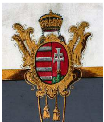
Magyar kiscímer barokk kartusban

bogó formailag megegyezik. Ugyanakkor az Alaptörvény és a jelkép használatát szabályozó 2011. évi CCII. törvény lehetővé teszi, a trikolor mellett meghatározott esetekben (nemzeti ünnepek, az ezekhez kapcsolódó és egyéb társadalmi, politikai, tudományos – rendezvények, katonai tiszteletadás alkalmával) címeres zászlók használatát is.