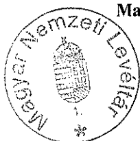
Magyar Nemzeti Levéltár Megrendelő