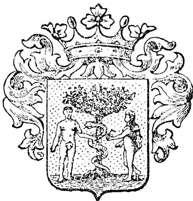
Baja mezőváros címere